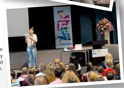
Mentorinnen und Mentee trafen sich am WellcomeDay zum ersten Mal und konnten etwas erleben.