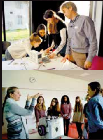
Impressionen der TecNight vom 23. Januar in Sarnen