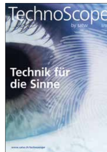
Die 2018 erschienen Ausgaben von Technoscope: «Technik im Sport», «Unterwegs – Technik bewegt» sowie «Technik für die Sinne».